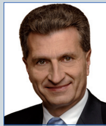
Günther H. Oettinger Ehemaliger Ministerpräsident Former Prime Minister