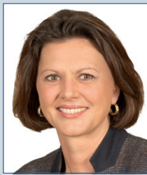
Ilse Aigner Bundesministerin Federal Minister