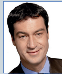
Dr. Markus Söder Mdl Bayerischer Staatsminister Minister of state

Several prominent figures and organizations help support REECO events by acting as patrons.